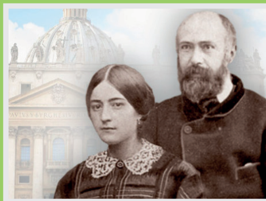
SANTI CONIUGI LUIGI MARTIN E ZELIA GUERIN

Se non alimentiamo la nostra capacità di godere del bene dell'altro e ci concentriamo soprattutto sulle nostre necessità, ci condanniamo a vivere con poca gioia, dal momento che, come ha detto Gesù, «si è più beati nel dare che nel ricevere!» (At 20,35). La famiglia dev'essere sempre il luogo in cui chiunque faccia qualcosa di buono nella vita, sa che lì lo festeggeranno insieme a lui." (Amoris Laetitia 110)