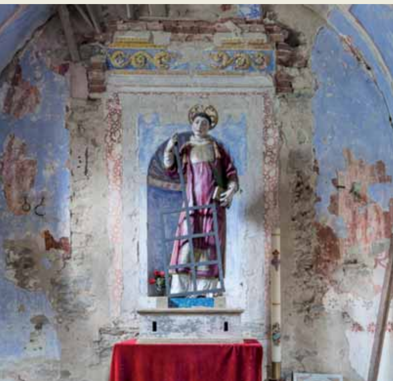
▲ Statua processionale di San Lorenzo

CONFESSIONI ogni giorno 8.00-8.30 9.00-11.00 • 16.30 17.00 18.30 domenica mezz'ora prima di ogni messa ADORA- ZIONE EUCARISTICA ogni giorno 9.00-12.00 • 16.00-18.30