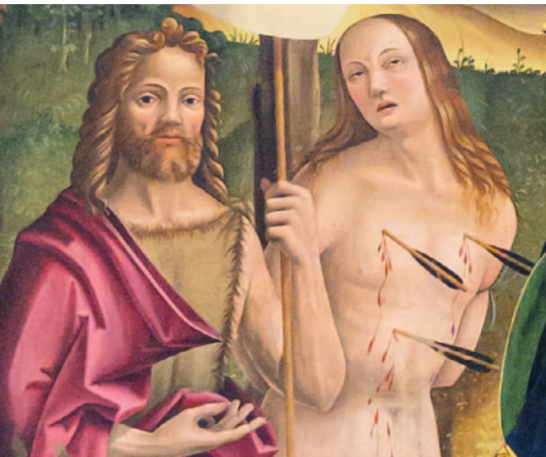
▲ Vincenzo Pagani, Madonna con il Bambino e i santi, particolare di San Giovanni Battista e San Sebastiano

• ADORAZIONE EUCHARISTICA ogni giorno 9.00-12.00 (eccetto la domenica) / 16.00-18.30 (anche la domenica) • CONFESSIONI ogni giorno 9.00-11.00 • 16.30, 18.30 domenica mezz'ora prima di ogni messa