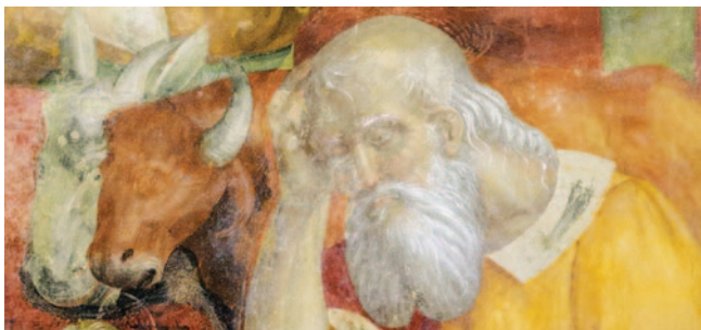
▲ Giacomo Bonfina, La Natività , particolare di San Giuseppe

ORARIO MESSE feriale 18.00; festivo 8.00, 11.00, 18.00 (pregevoli mosaici) • ROSARIO e FESTA Giardino della Madonna della Pace luglio e agosto 21.15