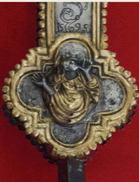
▲ Croce astile, particolare, bottega dell'Italia centrale, 1595, Faraone, chiesa di San Vito

CONFESSIONI ogni giorno 8.00-8.30 9.00-11.00 • 16.30 17.00 18.30 domenica mezz'ora prima di ogni messa ADORA- ZIONE EUCARISTICA ogni giorno 9.00-12.00 • 16.00-18.30