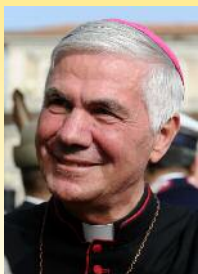
Mons. Giovanni D'Ercole Vescovo di Ascoli Piceno