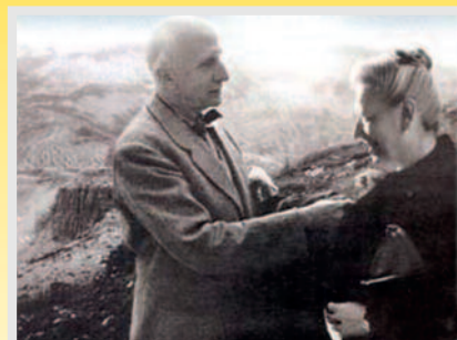
BEATI CONIUGI LUIGI E MARIA BELTRAME QUATTROCCHI

Da Montemonaco (AP), bisogna uscire dal paese in direzione Montegalgo ed a soli 500 mt fuori dal paese, al bivio che si incontra, si deve seguire le indicazioni per Rubbiano – Gole dell'Infernaccio. Dopo circa 8 km, e dopo aver attraversato alcune frazioni, si arriva al bivio che porta al parcheggio dell'inizio del percorso. La località di riferimento è Rubbiano (AP), nei pressi di Montefortino e non distante da Montemonaco. Dopo circa 2 KM si arriva in una specie di slargo che termina con 2 blocchi di cemento lasciati lì allo scopo di impedire l'ulteriore traffico di autoveicoli.