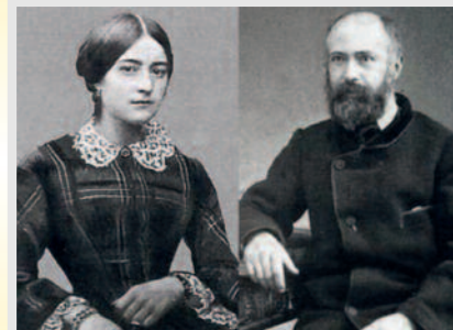
BEATI CONIUGI LUIGI MARTIN E ZELIA GUERIN

PER INFORMAZIONI E PRENOTAZIONI RIVOLGERSI A