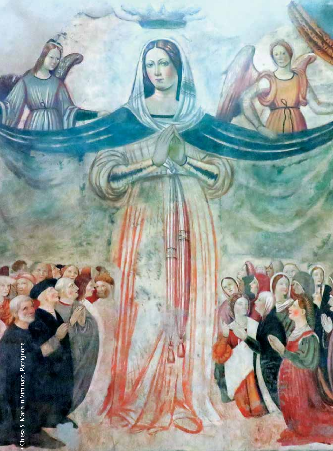
• Chiesa S. Maria in Viminato, Patrignone